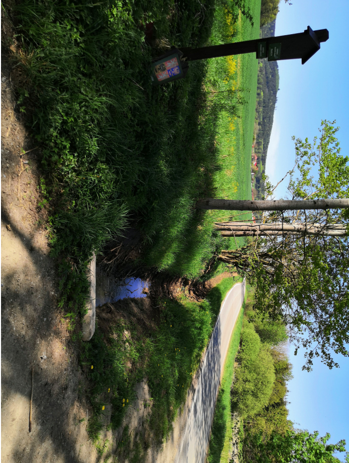
Pohled vlevo směrem do Jankova