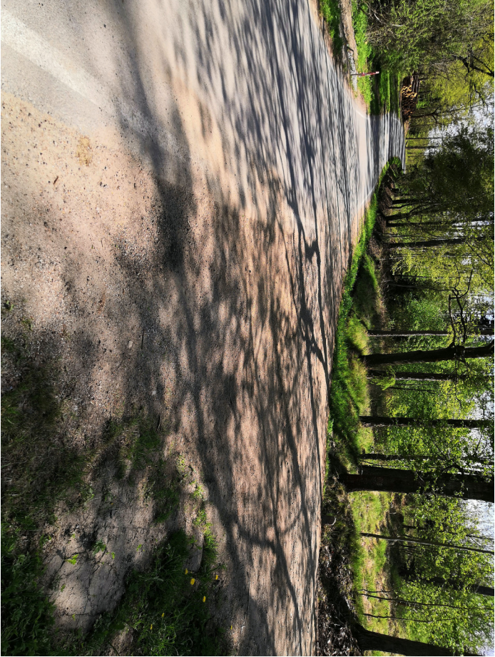
Pohled vpravo směrem do Čakovce

Na začátku se cesta napojuje na silnici III/14319a vedoucí z Jankova do Čakovce. Rozhledové poměry tohoto napojení byly posouzeny dle ČSN 736109 č. 11.2.1. Napojení se nachází na vnější straně směrového oblouku silnice III/14319a o poloměru R=70 m, na který ve směru na Čákovec navazuje protisměrný oblouk o poloměru 80 m. Dle ČSN 736102 č. 5.2.9.1.1 je mezní rychlost v tomto oblouku v_m=55 km/h. Ve směru doleva z polní cesty je dosahovaná délka pro zastavení 120 m což odpovídá dovolené rychlosti 90 km/h. Ve směru doprava z polní cesty je dosahovaná délka pro zastavení 75 m což odpovídá rychlosti 70 km/h, tzn. větší než mezní rychlosti 55 km/h. Odsazení rozhledu z polní cesty je 3 m. Rozhledové poměry vyhovují.